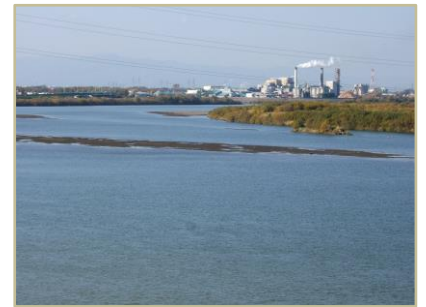
石狩川のようなす

『江別観光協会創立30周年記念誌』（昭和63年発行）によると、発足当初は絵はがきの製作販売や、江別一石狩港、江別一炭戸 ばらと を結ぶ「石狩川観光ライン」と称した遊覧船事業、泉の沼での貸しボート設置などを行っていたことがわかります。中でも「石狩川観光ライン」は多くの人で賑わい、昭和37（1962）年には4隻の遊覧船が就航していました。また、昭和43（1968）年の石狩町（当時）開基300年の記念事業では、石狩川流域のさらなる発展を図ろうと、「石狩川そ上の旅」が催され、石狩町長が遊覧船で江別を親善訪問しました。