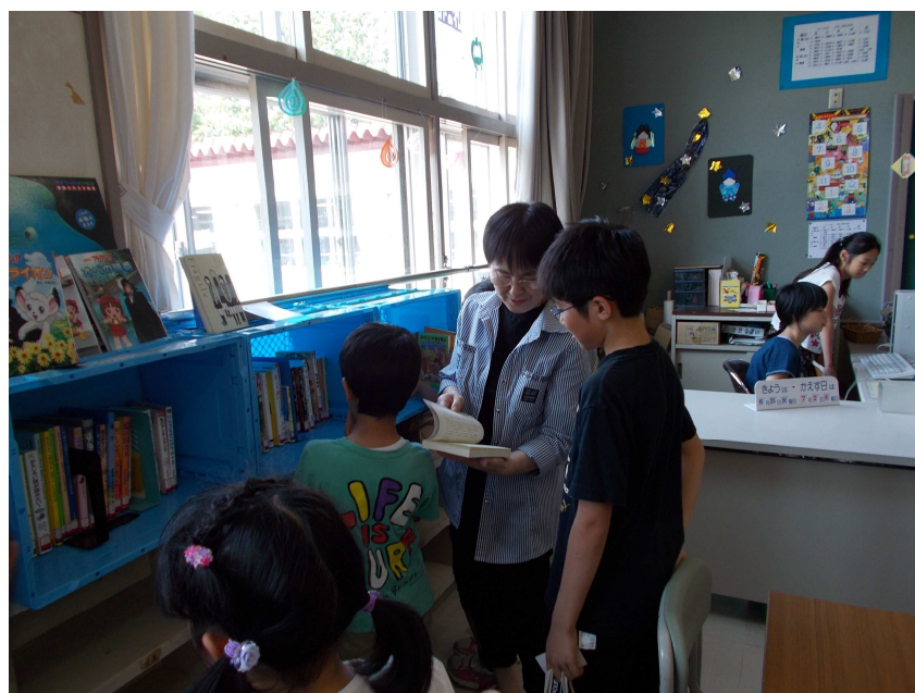
学校司書の活動の様子（江別第二小学校）

本市においても同様な事情にあることから、これまでも学校司書は必要に応じて「指導」に関わり、多忙な司書教諭等をサポートしてきました。今後も司書教諭等と学校司書は常に連携をとりながら、多様な読書活動を企画・実施し、学校図書館サービスの改善・充実を図ることが望ましく、学校図書館の活性化や児童生徒にとって機能的に利用しやすい環境の維持のため、年に1回は学校図書館へ支援できるような人員体制の検討を進めていきます。