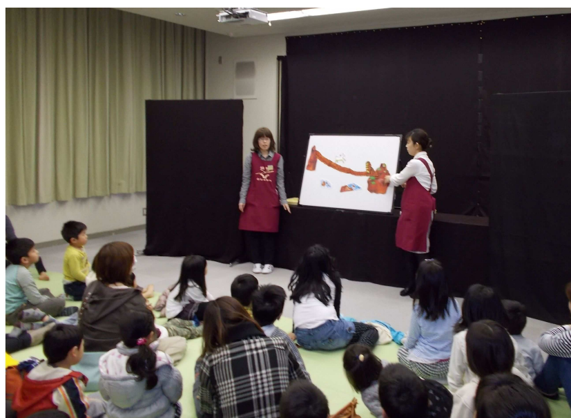
「おはなし会スペシャル」の様子（平成25年4月27日）

そのためには、学校や情報図書館、児童センター等における読書活動の実態を踏まえて、読書活動の推進に向けた場所や機会を提供することによって、望ましい読書環境づくりに努めることが重要です。