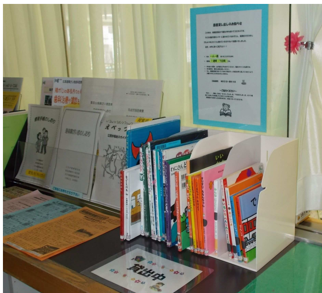
子ども発達支援センターの 図書貸出コーナー